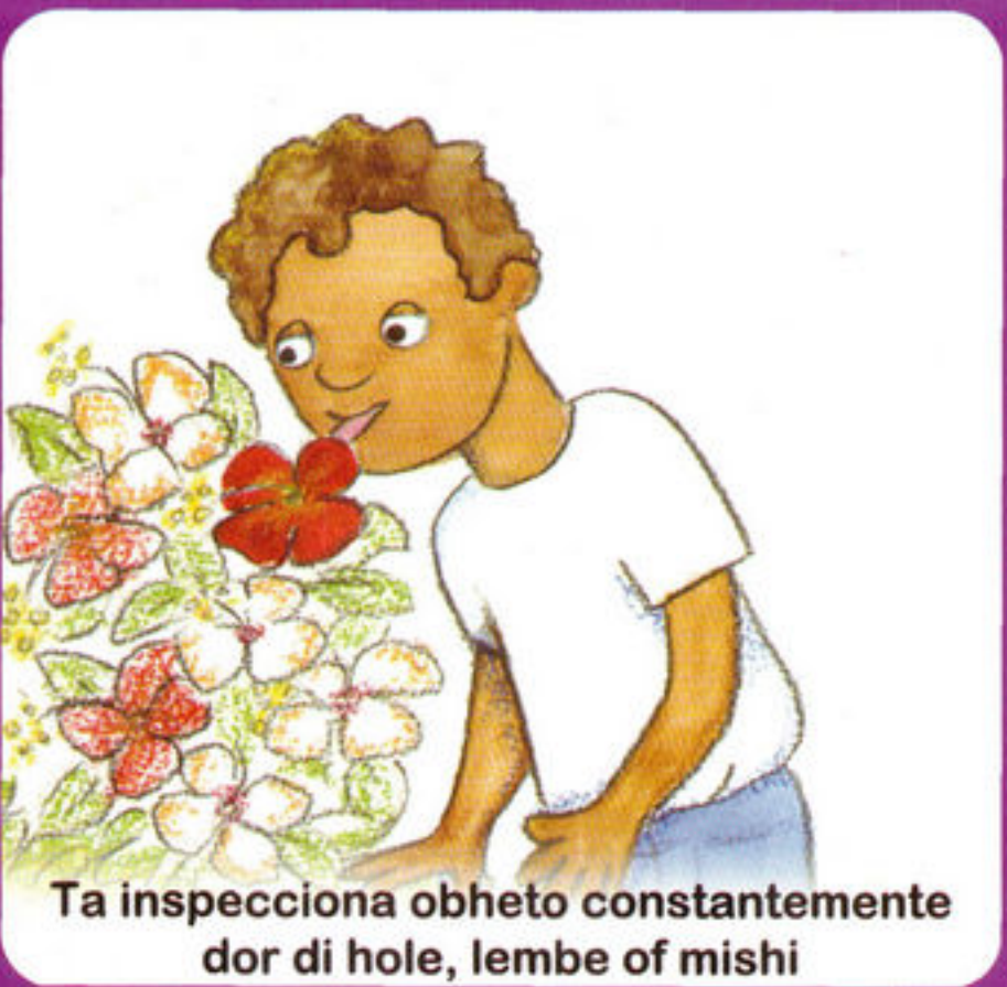
Ta inspecciona obheto constantemente dor di holer, lembe of mishi